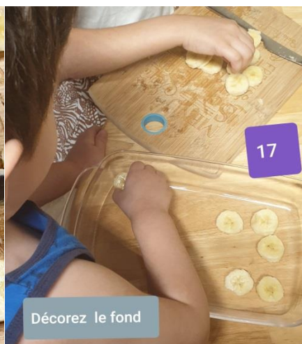
Décorez le fond