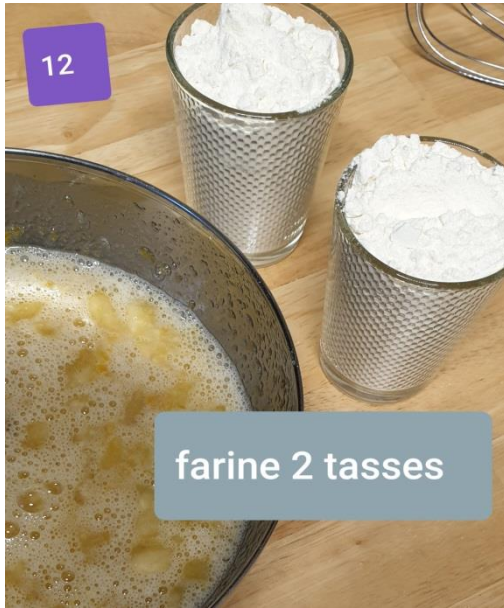
farine 2 tasses