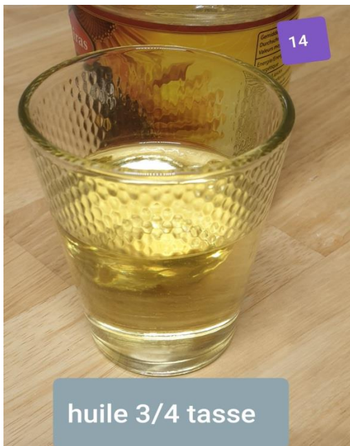
huile 3/4 tasse